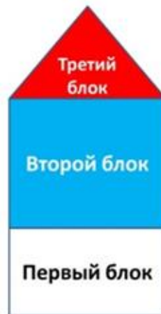
Блоки развития головного мозга у детей

Нейропсихологическая коррекция представляет собой трехуровневую систему. Каждый из уровней коррекции имеет свою специфическую “мишень” воздействия и направлен на все 3 блока мозга: